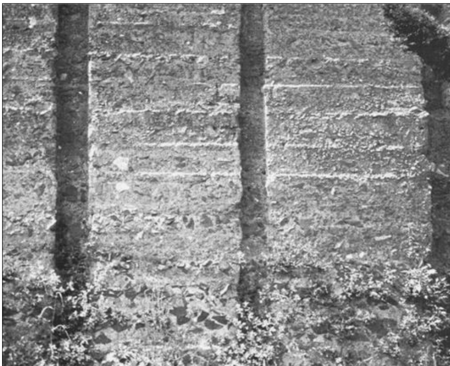
Fot. 3. Rzym, fundament betonowy